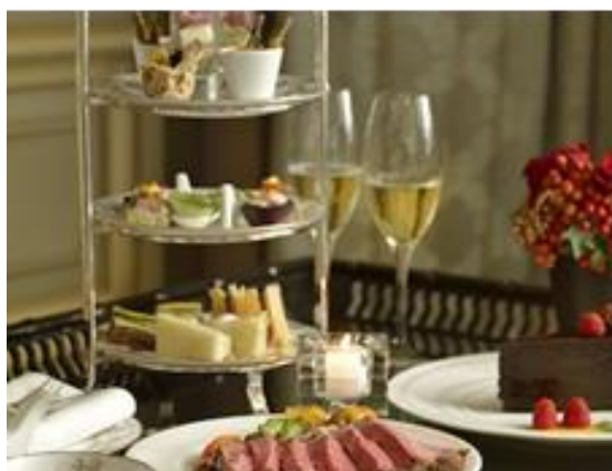
▲椿山荘「ロビーラウンジ・ジャルダン」のハイティー

『一休.com レストラン』ハイティーが楽しめるディナー https://restaurant.ikyuu.com/t-genre/t-genre1368/05/