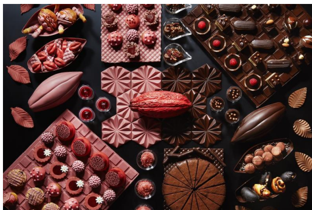
▲ANAインターコンチネンタルホテル東京「シャンパン・バー」でルビーチョコが楽しめる「チョコレート・デザートbuffet」プランも販売開始