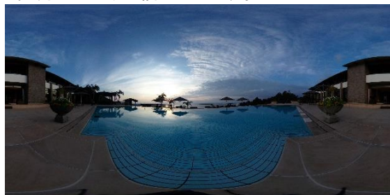
sankara hotel &amp; spa 屋久島(「RICOH THETA」にて撮影)

高級ホテル・旅館の予約サイト『一休.com』( https://www.ikyuu.com/ )の株式会社一休(本社:東京都港区、代表取締役社長:榑 淳、以下一休)が運営するトラベルWEBマガジン『一休コンシェルジュ』は、株式会社リコー(本社:東京都大田区、代表取締役社長執行役員:山下良則)とのコラボコンテンツ【「一休コンシェルジュ」×「RICOH THETA」ここに贅沢な絶景時間】を、2019年4月23日より配信いたします。