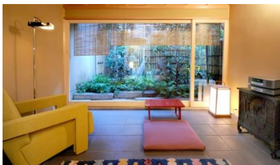
▲ スイート客室「若菜」

株式会社一休が運営するトラベルWEBマガジン「一休コンシェルジュ」で、「要庵 西富家」の魅力を紹介する記事を10/8に公開しております。(「伝統とは革新の連続」。世界中の賓客をもてなす京都の老舗旅館「要庵 西富家」: https://www.ikyuu.com/concierge/58976 )